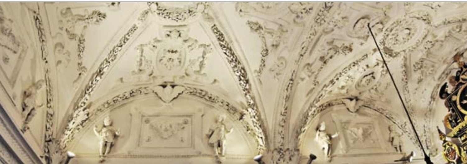
Die Stuckdecke in ihrer kunstvollen Ausschmückung verleiht der kleinen Kapelle Größe und Pracht.

Das genaue Entstehungsjahr der Schlosskapelle ist unbekannt. In der Sandersdorf'schen Matrikel (KIRCHENVERZEICHNIS) aus dem Jahr 1524 wird sie noch nicht genannt. Erst in der Schmidt'schen Matrikel aus den Jahren 1738/40 erscheint sie als „ elegans capella in arce Taufkirchen, in der ein Altar zu Ehren der seligsten Jungfrau Maria vorhanden, unter dem der öffentlichen Verehrung ausgesetzt ist der Leib St. Victoris Martyris “. Es scheint sich also die Vermutung zu bewahrheiten, dass die Kapelle während der Zeit der Fuggerherrschaft in Taufkirchen, nach 1554, errichtet wurde. Ein Zeitzeugnis dafür ist wohl auch die noch vorhandene Glocke mit der Inschrift: „ Ulrich Maisperger zu Augspurg gos mich im MDLVII (1557) Jahr. “