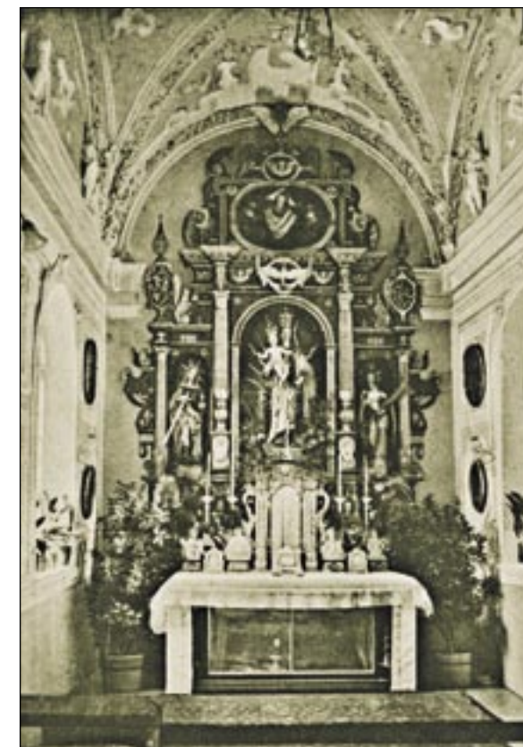
Die Ansicht aus den 30er Jahren zeigt, dass sich die Ausstattung der Kapelle kaum verändert hat. Allerdings ist hier die Decke noch farbig ausgemalt, die man bei der Restaurierung 1987 wieder in den ursprünglich weißen Zustand zurückversetzte.

Engel aus Stuck. In früherer Zeit soll sich der Altar an der Westseite des Raumes befunden haben und die Kapelle vom ehemaligen östlich liegenden Haupttreppenhaus aus zugänglich gewesen sein. Wie die zugemauerten Rundbogenfenster im Dachgeschoss der Sakristei zeigen, hatte die Kapelle vermutlich bis Mitte des 18. Jahrhunderts drei große Außenfenster zur Südseite hin. Um für die Ordensschwestern des Klosters Aulburg bei Straubing, die ab 1921 die Pflege der neuen Schlossbewohner übernommen hatten, mehr Platz zu gewinnen, wurde die Sakristei verkleinert und dadurch ein Oratorium für die Schwestern geschaffen. Als Durchblick in den Altarraum diente ein ehemaliges Außenfenster. An der Westseite wurde die Wand zum Krankensaal mit einer korbogenartigen Fensteröffnung versehen, um auch den Kranken den Blick zum Altar zu ermöglichen. Als wenige Jahre später der Krankensaal aufgelöst wurde, gestaltete man daraus einen Betsaal. Im Zuge der Schlossrenovierung wurde 2006 der Betsaal zum neuen Trauungszimmer der Gemeinde Taufkirchen (Vils) und seitdem als solches genutzt.