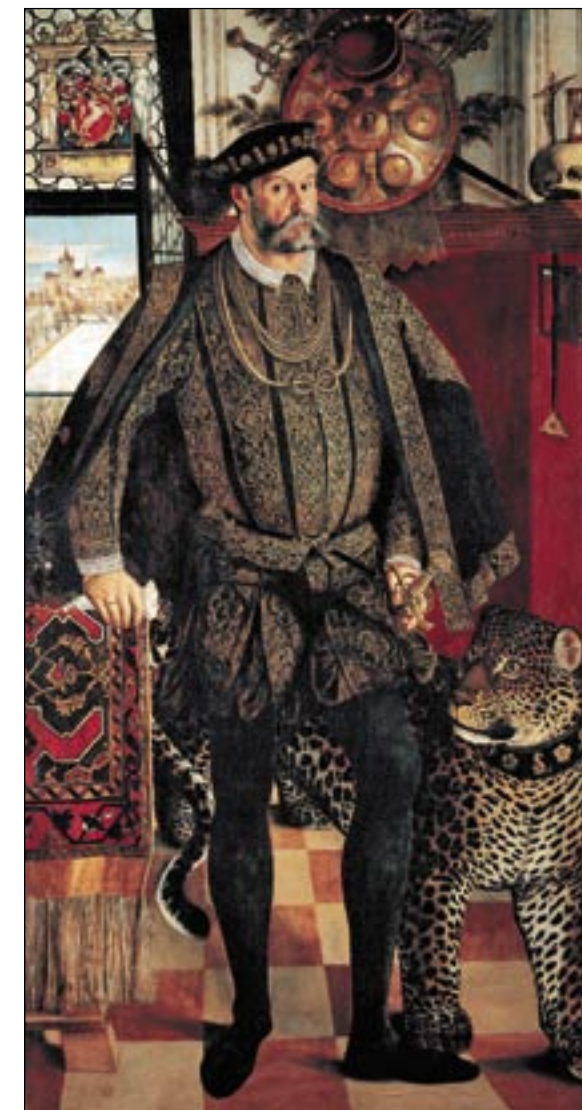
Das imposante, lebensgroße Porträt von Ladislaus von Fraunberg, Graf zu Haag, gemalt von Hans Mielich, 1557, Öl auf Leinwand, Höhe 214 cm, Breite 113 cm