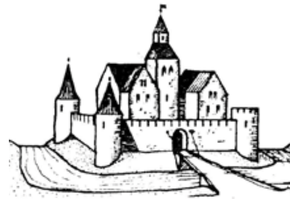
Diese erste bildliche Darstellung vom Schloss Taufkirchen erstellte wahrscheinlich Philipp Apian vor 1568.

Es ist also denkbar, dass die neu erbaute Taufkirche dem Ort ihren Namen gab und dabei eine ältere Bezeichnung verdrängte. In einer Urkunde des Stiftes St. Castulus zu Moosburg erschienen bereits Anfang des 11. Jahrhunderts ein Albero und Olrich de Taufchirchin . Im Jahre 1140 tauchte in den Urkunden ein Gerhart von Taufkirchen auf. Bereits 10 Jahre später ist von